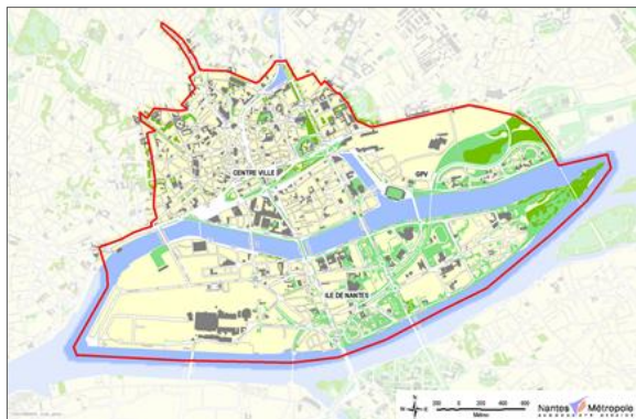
Périmètre d'études