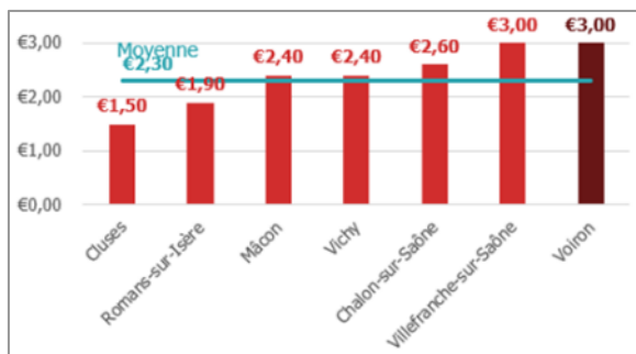
Coût de 2 h de stationnement sur voirie à Voiron et dans des villes de taille similaire