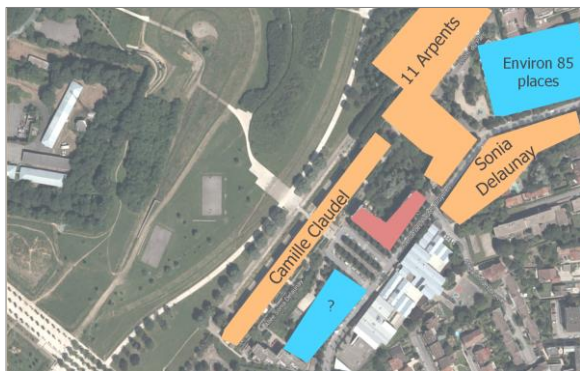
Analyse du contexte hors voirie