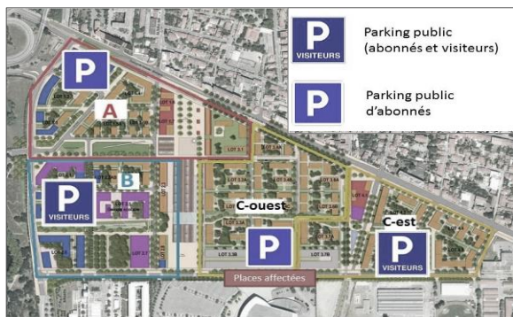
Emplacement des 4 parkings et types d'utilisateurs accueillis

Depuis 2013, Sareco assiste OPPIDEA dans la mise en œuvre opérationnelle de la stratégie de stationnement , qui repose sur une mixité d'offre sur parcelle et en parkings silos publics mutualisés et foisonnés (4 ouvrages totalisant 1 850 places environ).