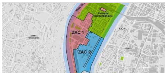
Contexte : les phases du projet Confluence