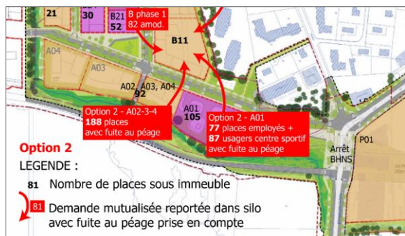
Extrait plan présentant la répartition places privées / parking mutualisé