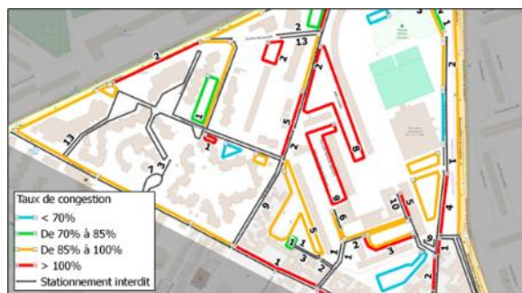
Extrait de la carte présentant les taux de congestion rue par rue